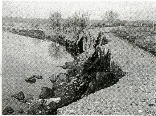
A sinistra come si presentava l'area sotto l'azione della piena del Trebbia. A destra, gli interventi di protezione dell'area

Un fatto grave, che ha suscitato preoccupazioni. L'Aipo, l'Agenzia che si occupa del Po, ha subito messo a bando un intervento per circa 95 mila euro, volto al rafforzamento di quest'area la quale oggi si presenta come un cantiere aperto. Si prevede che gli interventi, iniziati in aprile, si conclu-