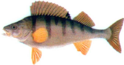
PERSICO REALE ( Perca fluviatilis Linnaeus) Famiglia: Percidae