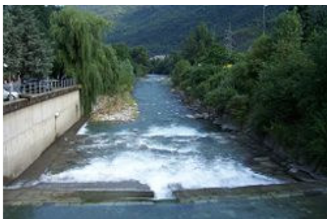
Fiume Oglio a Berzo Demo, Val Camonica