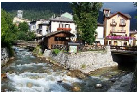
Nascita dell'Oglio Ponte di Legno

L' Oglio ( Òi in camuno, bergamasco, bresciano e mantovano, Ùi in cremonese) è un importante fiume italiano, affluente del Po, che scorre in Lombardia, nelle province di Brescia, Bergamo, Cremona e Mantova. Nella gerarchia degli affluenti del Po occupa con i suoi 280 km di corso il 2° posto per lunghezza (dopo l'Adda), mentre risulta il 4° per superficie di bacino (dopo Tànarò, Adda e Ticino), ed il 3° per portata media alla foce (dopo Ticino e Adda);