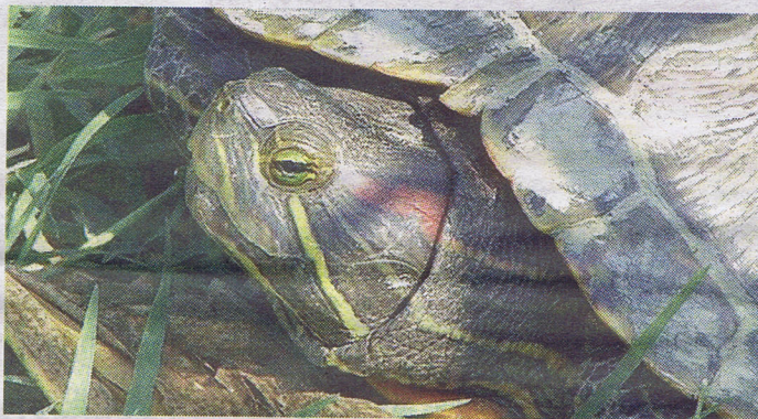
Una serie di incontri lungo gli argini del Po: sopra, dall'alto, Zerynthia polyxena , una rara farfalla che popola gli argini, e una tartaruga palustre americana; sotto, un gambero della Louisiana e una libellula