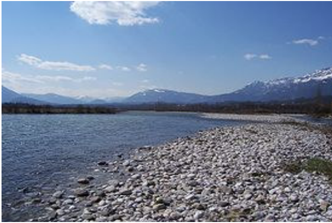
Il Piave in Provincia di Belluno, tra Mel e Santa Giustina