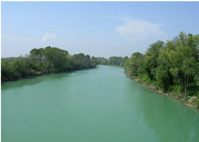
Il Piave attraverso la Pianura Veneta