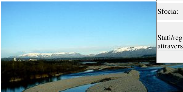
Il_Piave a sud di Ponte della Priula

Il fiume Piave (localmente e originariamente "la Piave", volto al maschile in accordo al genere di fiume dopo la prima guerra mondiale perché ritenuto inappropriato chiamare con un nome femminile un fiume divenuto sacro alla patria [senza fonte] ) nasce nelle Alpi Orientali e più precisamente nelle Alpi Carniche, alle pendici meridionali del Monte Peralba, nel comune di Sappada, in provincia di Belluno, a quota 2.037 m s.l.m.. La sua foce è nel Mar Adriatico, a nord-est di Venezia, presso il porto di Cortellazzo fra Eraclea e Jesolo. Sulla sinistra della foce è collocata la Laguna del Mort, enclave di acqua marina sorta nell'area di un braccio morto del fiume. È il quinto fiume d'Italia per lunghezza fra quelli direttamente sfocianti in mare.