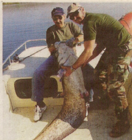
Pescatori con due esemplari di pesce-siluro: è una delle specie di cui è vietata l'immissione in Po

que nei nostri fiumi. Ospiti, come i siluri, che si pongono in competizione con le nostre specie autoctone, portandole alle soglie dell'estinzione. E sotto accusa non c'è solo il siluro: gli fanno compagnia l'Aspio, il Barbo d'oltralpe, la